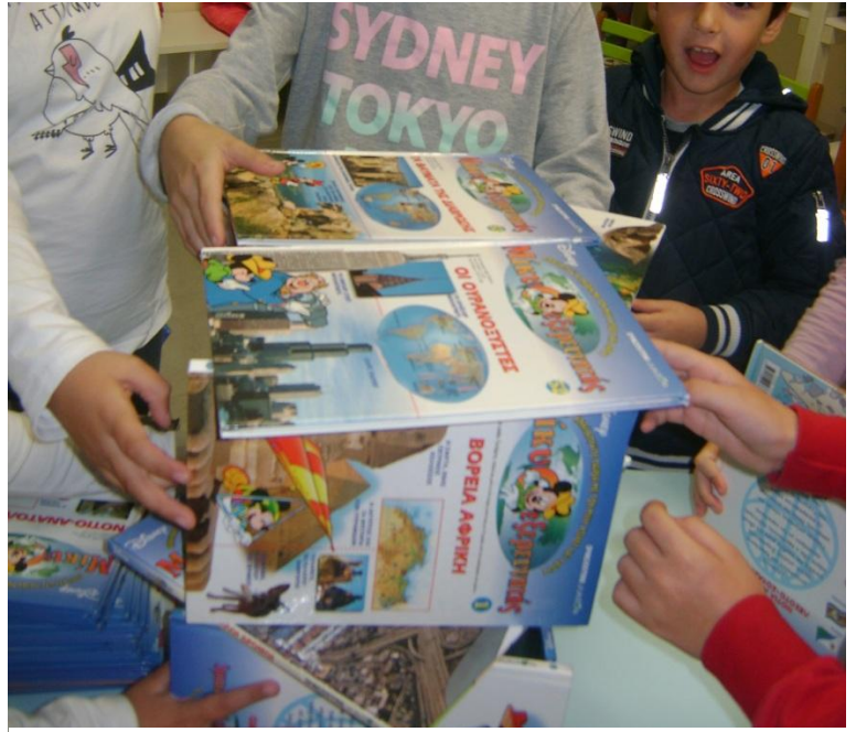
Παίζοντας με τα βιβλία