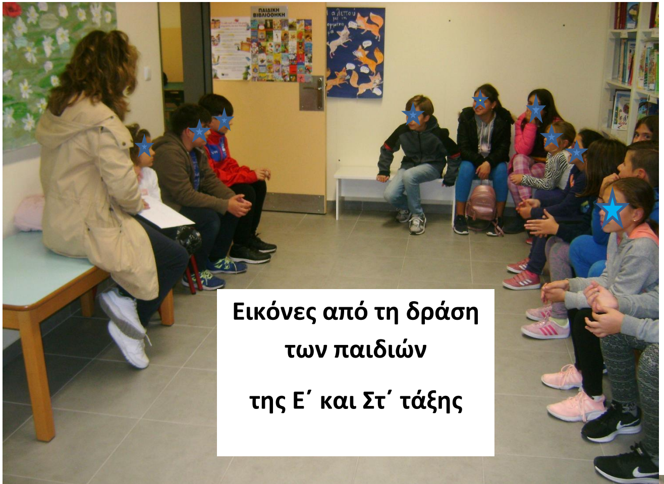
Εικόνες από τη δράση των παιδιών της Ε΄ και Στ΄ τάξης